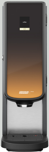
Bolero 11 zonder heetwateraftap