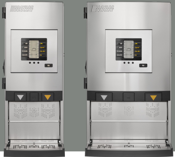
Bolero Turbo XL 403