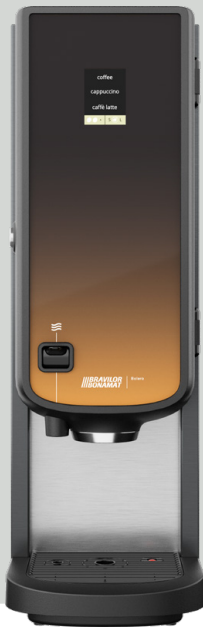
Bolero 21 met heetwateraftap