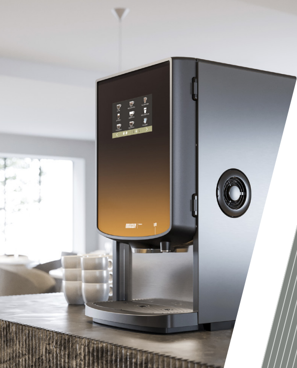
Bolero Turbo 403