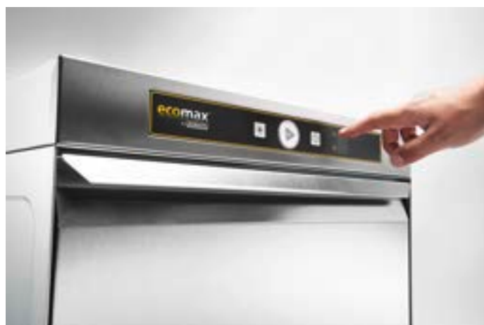
Uiterlijk Ecomax modellen