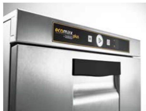
Uiterlijk Ecomax plus modellen